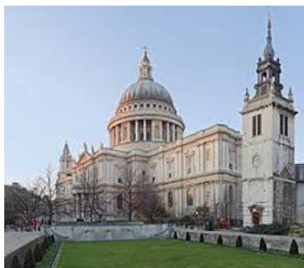
Catedral de San Pablo en Londres

El Barroco tuvo un carácter más clásico y racional, destacó el arquitecto Christopher Wren, autor de la Catedral de San Pablo, en Londres (1675-1708). De estilo Renacentista y Barroco Inglés, cuenta con una inmensa cúpula de 111 metros de altura, es la segunda catedral más grande, tras el Vaticano.